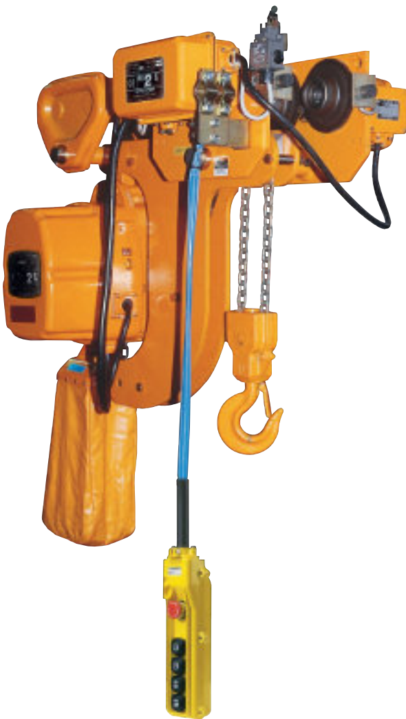
KFR/2S - KFR/2

Disponibili con portate fino a 2000 kg, nelle versioni con carrello elettrico, a spinta o meccanico.