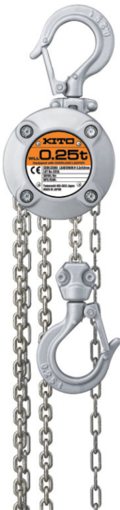
TIPO CX003 CX003 TYPE