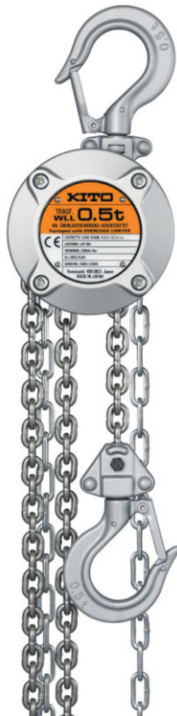
TIPO CX005 CX005 TYPE