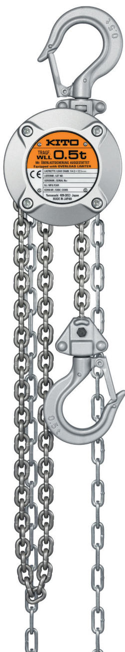
TIPO CX005 CX005 TYPE